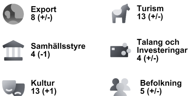
Tabell 2.9 Sveriges ranking per område i Nation Brands Index 2022. Siffror inom parentes avser föregående år.

En indikator för effekterna av Sverigefrämjande insatser är oberoende bedömningar av Sveriges varumärke. Enligt Nation Brands Index, ett av flera index som mäter länders varumärken, behöll Sverige 2022 plats 9 av de 60 länder som mättes. Vid sidan av detta visar en rad andra index att Sverige bilden är stabil över tid.